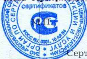
Схема сертификации 3.

Периодичность проведения инспекционного контроля-один раз в год.